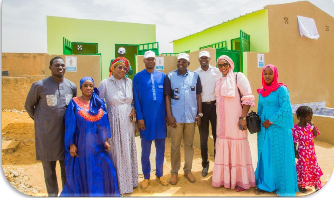
Inauguration du bloc sanitaire de Mbolo Birane (Podor) financé par la Fondation BOA et réalisé par ADEMAs

Ou encore avec d'autres organisations parmi lesquelles le Ministère des Collectivités territoriales, de l'Aménagement et du Développement des territoires (MCTADT) à travers ses structures telles que la Direction de la Coopération décentralisée (DIRCOD) l'Agence de Développement Municipal (ADM), l'Agence de Développement Local (ADL) et le Programme National de Développement Local (PNDL) pour formaliser la relation de partenariat entre ces structures du MCTADT et ADEMAs en vue de contribuer au financement de projets communautaires pour le bien-être des populations.