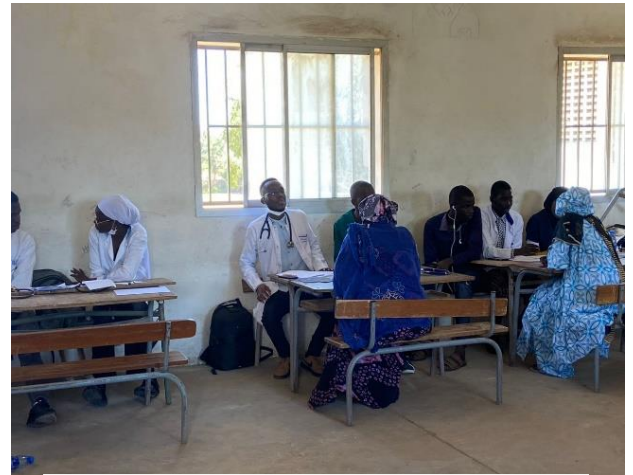
Photo 3 : Journée de consultation gratuite dans une salle de classe du lycée de Mbaou

Dans l'ensemble les femmes ont apprécié la démarche et suggèrent la duplication de ces activités au niveau de leurs quartiers afin d'en faire bénéficier le maximum de personnes.