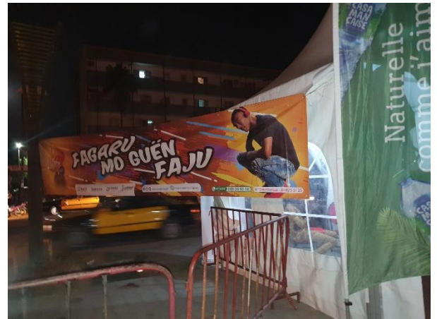
Photo N°2 : La banderole FAGARU bien positionnée devant le stand de ADEMAs lors du concert organisé à Dakar