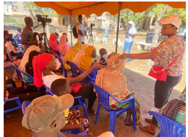
Photo 4 : sensibilisation des personnes qui attendent les consultations gratuites au niveau de la cour du lycée

522 personnes consultées (169 Hommes et 353 femmes)