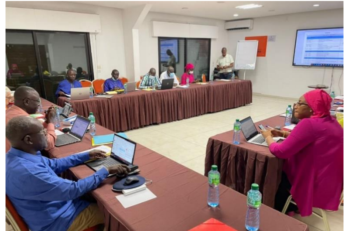
Image 1 : Présentation des participants avec le représentant de NPI en chemise bleu

Pour chaque produit une collecte de données a été faite auprès des participants pour compléter les informations afin de justifier les analyses et les décisions à venir. Les données recueillies sont organisées et classées selon la fonction marketing concernée (produit ou prix ou place ou promotion) et l'acteur concerné dans la chaîne de distribution.