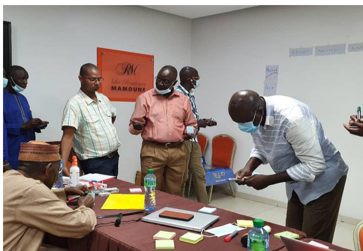
Image 4 : Contribution active des membres d'ADEMAS, de Didy, du CA et de la SCOOPS BE-Fam dans la collecte d'informations