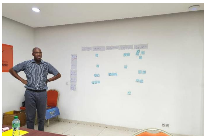
Image 6 : le spectre d'un des produits enrichis par la vingtaine d'infos qualitatives données exprimées sur post-it collés au mur

ADEMAs veut relancer l'achat les MILDA car la demande est forte et la marge intéressante. Le seul problème c'est le coût d'acquisition qui est élevé. Les spécifications techniques du Milda seront recueillis par une prospection du marché international à travers les sites mondiaux de commerce entre autres. Par ailleurs, ADEMAs compte participer à la rencontre des organisations qui bossent sur le marketing social en Afrique de l'ouest au mois d'août pour voir comment s'associer en hub régional de distribution pour l'achat de MILDA groupé.