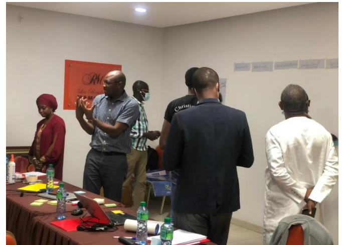
Image 3 : Echanges lors de la collecte d'informations sur les produits